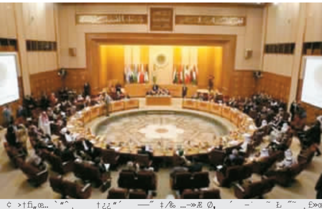
府的武装部队起冲突,并迅速占领了整个贝鲁特西市区,并导致至少34人死亡,国家也险些陷入内战。真主党在黎巴嫩政府军介入贝鲁特冲突,否决了两项政府政策后,同意撤离贝鲁特。这意味着,亲真主党的贝鲁特机场保安主任在接受调查期间,将能够继续留任;黎巴嫩政府军也将研究真主党的电讯网络系统,以确保它不会对公

另据新加坡《联合早报》报道,较早时候,真主党武装部队因与政府意见分歧,在首都贝鲁特与亲政